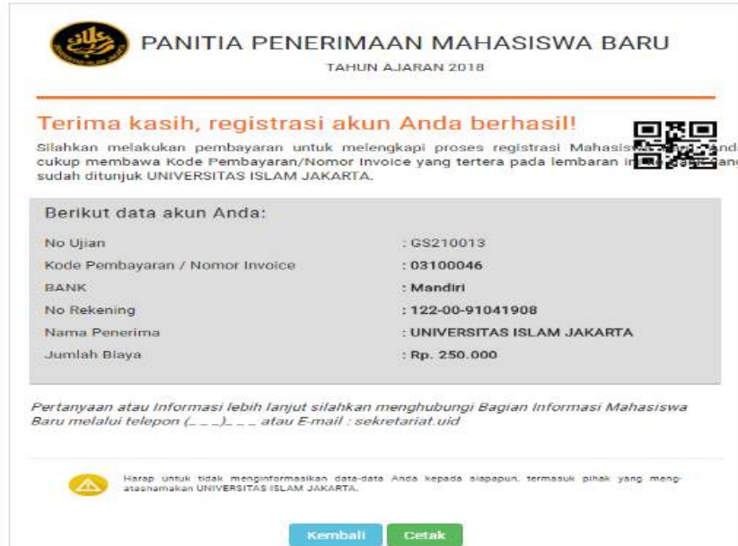
Gambar 5 Konfirmasi Bukti Pembayaran Pendaftaran telah berhasil