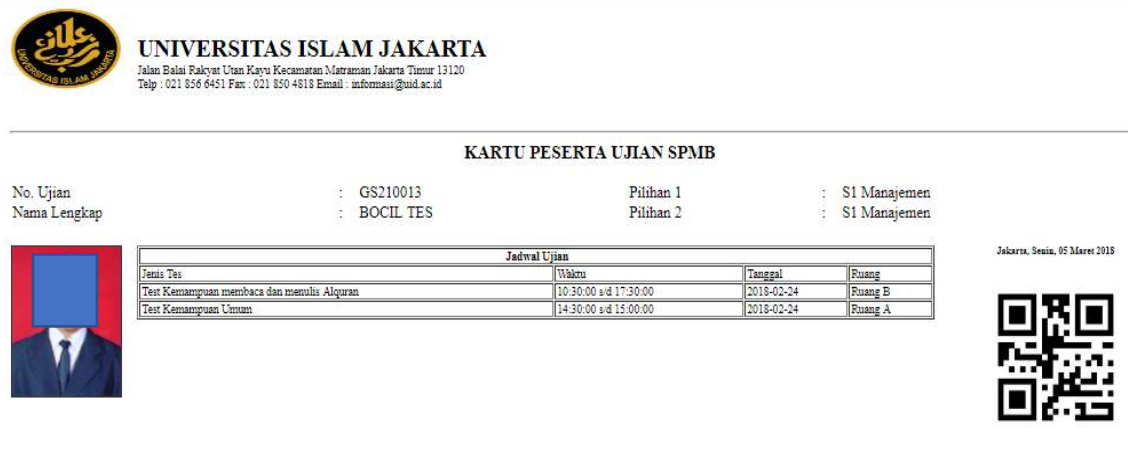
Gambar 6 Cetak Kartu Peserta Ujian SPMB