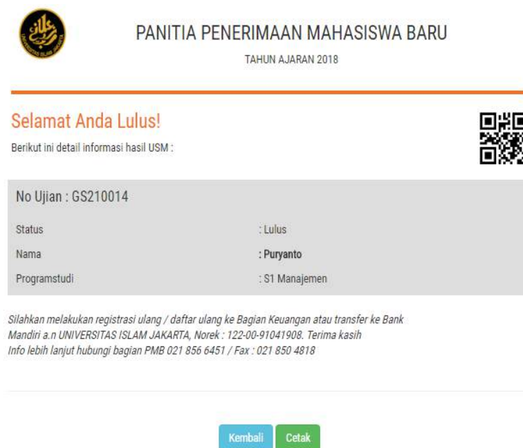
Gambar 7 Hasil Pengumuman Ujian SPMB

Setelah melaksanakan ujian, mahasiswa dapat melihat hasil ujian sesuai dengan tanggal yang telah ditentukan oleh pihak Universitas Islam Jakarta. Untuk melihat hasil ujian, calon mahasiswa dapat Login kembali ke http://pmb.uid.ac.id pada menu Cetak Hasil Ujian .